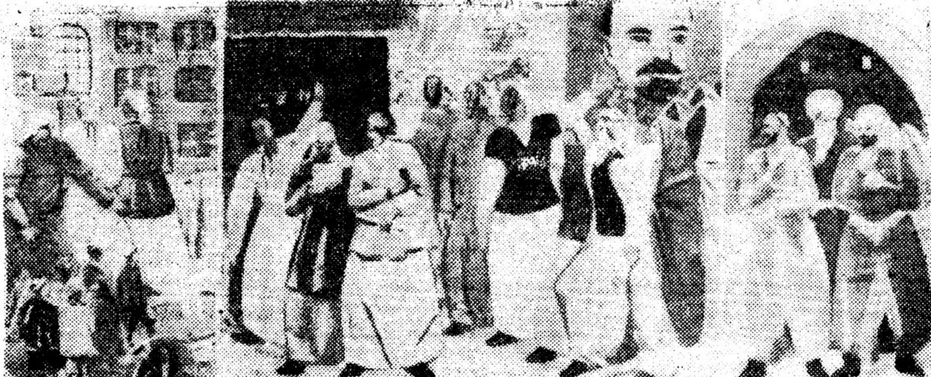
Урал Тансыбаев. «Раскрепощение женщины».