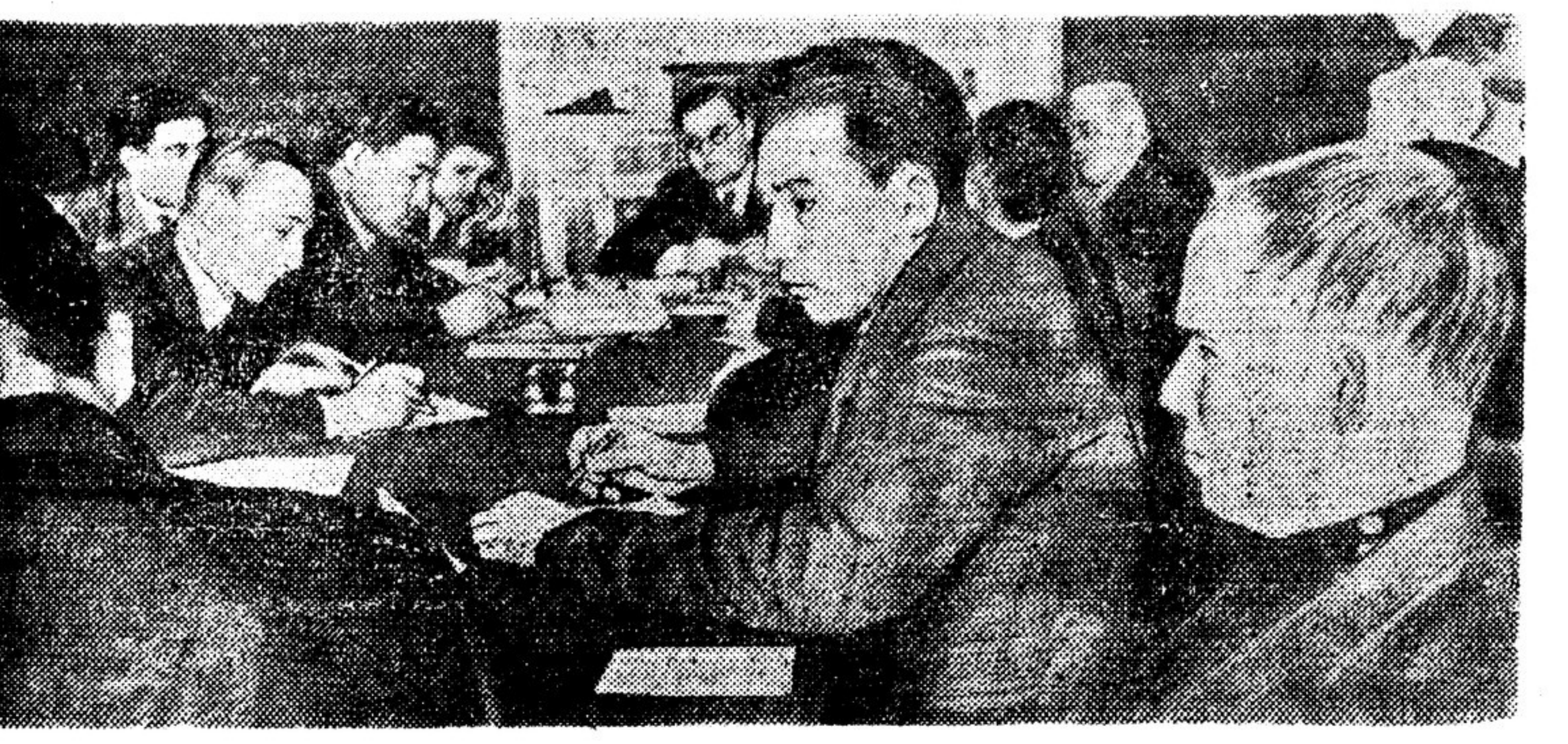
Совещание председателей областных и краевых советов писателей в ДСП 8 марта.